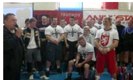
Takto zahajoval MČR v roce 2010 starosta města Trutnova Mgr. Ivan Adamec.